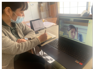
上写真：旭川のあみちゃん、北広のともみさん、岩見沢のわたしでサブリーダーZoom会議。「便利な世の中だね～」と言いつつも、会いたくてうずうず。(笑)

早速新年度、新しいことにチャレンジしてみよう！と只今企画真っ最中の「暮らしの保健室Zoom会」。まず、Zoomってなんぞや？Zoomとは「テレビ会議と同様に映像（ビデオ）と音声を使って、社外にいる相手とのコミュニケーションを可能にし、ビジネスシーンでの昨日が特に洗練されたツール」。といっても...なんだか難しい。簡単にいうと「直接会いに行かなくとも、顔を合わせてお話をすることを可能にするもの」です！コロナ禍で、私たちもZoomをよく使うようになりました。ただ、直接顔を合わせて話をするのをこれまで大切にしてきた中で、Zoomばかりに頼るのはちょっと・・・？と覚めることも。でも、今までコロナを気にして「できない」になってしまっていたことを「できる」に変えるきっかけの一つなんだと転換し、上手く活用していくことが重要なのではないかと思います。