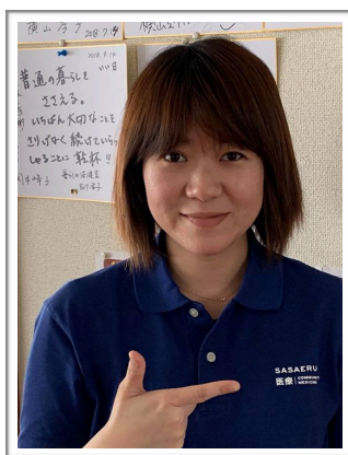
訪問看護ステーションささえるさん