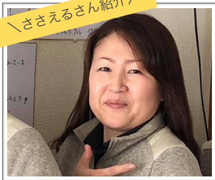
ケアマネージャー・相談員副室長