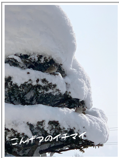
こんげつのイチマイ